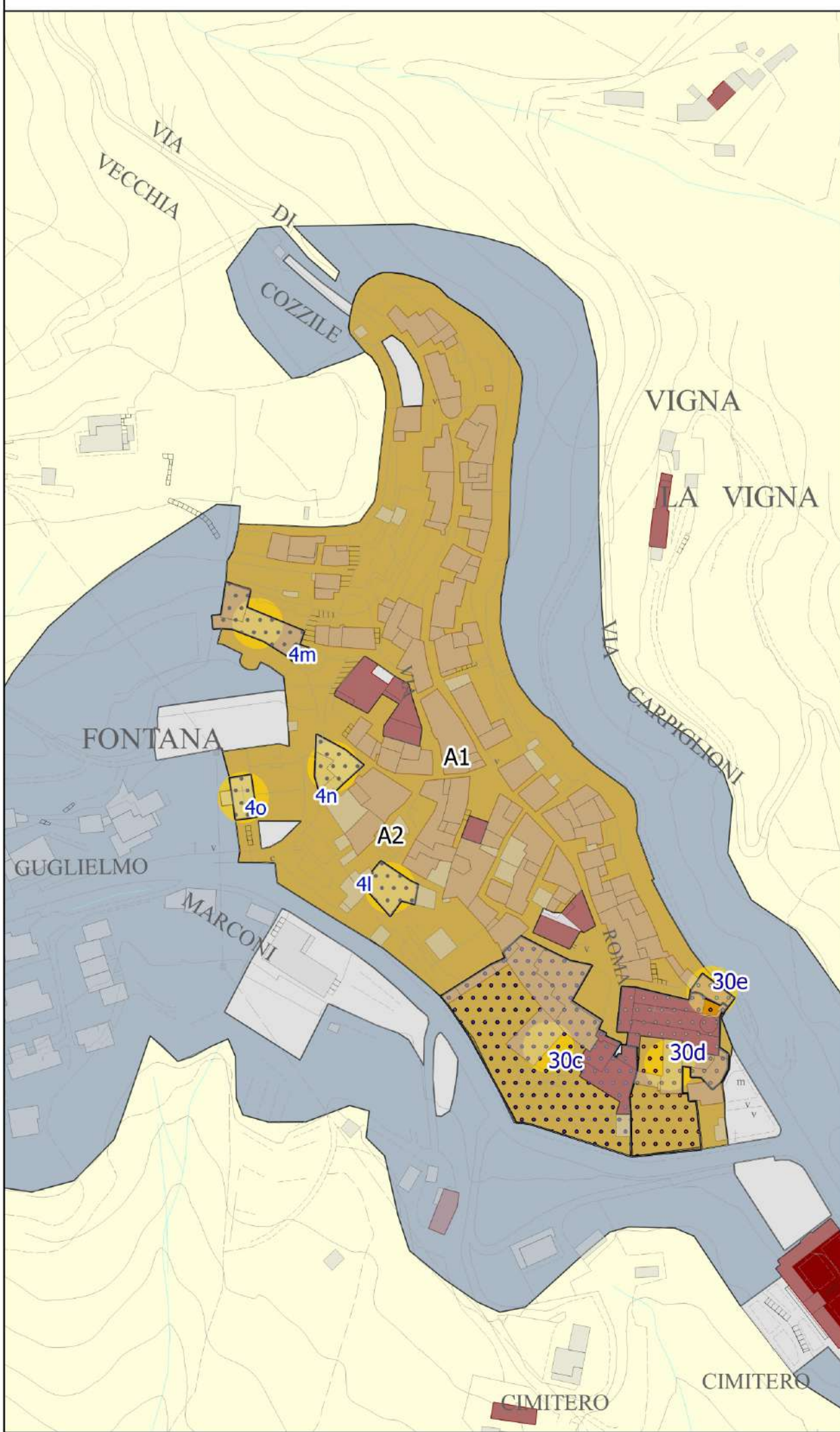
Particolare A - Scala 1:2000